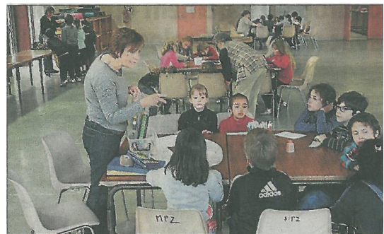
Un atelier de travail de 8 enfants avec le professeur