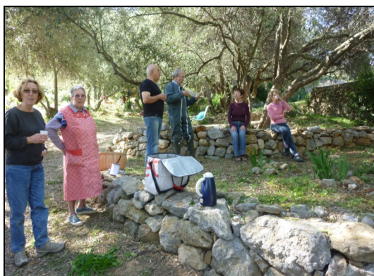
Un instant de pause pour les bénévoles de l'ASFEP

Un spectacle conté sera organisé le 29 juillet par l'association dans cet écrin de verdure.