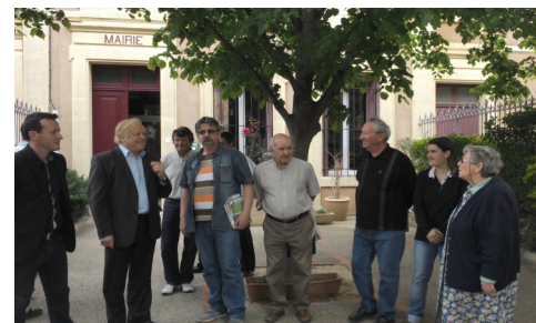
Le Sénateur a posé un instant dans la cour, au pied du tilleul planté en 1989, et pour lequel il avait donné le premier coup de pioche.

Cette rencontre fut encore une fois l'occasion de discuter sur la situation des Vignerons du Mont Tauch, pour lesquels il a réaffirmé son total soutien.