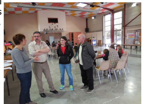
Monsieur Le Maire et deux de ses adjoints ont honoré de leur présence cette jolie exposition

Vous avez pu admirer le travail fait par les élèves sur les collections de 100, les différentes écritures possibles de 100, les exposés sur 100 objets, 100 couleurs, 100 animaux, 100 langues, 100 questions, vous avez répondu aux 100 défis mathématiques lancés par les élèves, vous avez dégusté les 5 variétés de 100 gâteaux, vous avez participé au défi des 100 signatures, ... et vous avez participé à la photo prise au terrain de tennis du nombre 100 écrit par « presque » 100 personnes ! Quelle belle journée ! MERCI à toutes celles et ceux qui ont permis sa réussite.